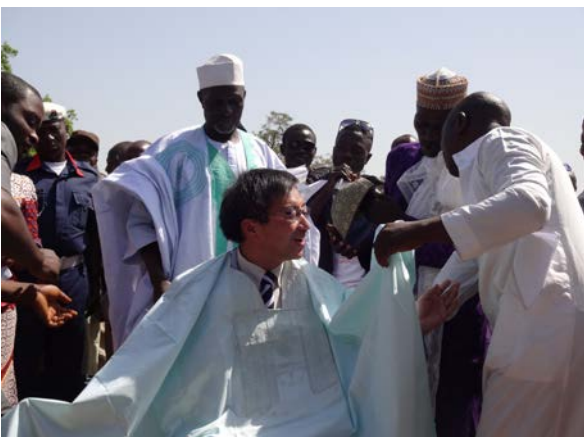
コミュニティによる伝統的タイトル授与式