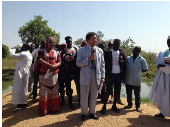
大塚臨時代理大使によるスピーチ